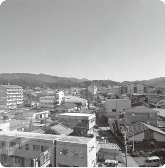
庁舎から見た土佐山田町

A 関係者へのヒア リング、トレンド調査、 プレサウンディング調 査等を行い、今のニー ズに合ったコンセプト の設定やブランド戦略 を基本計画に反映させ るためのものである。