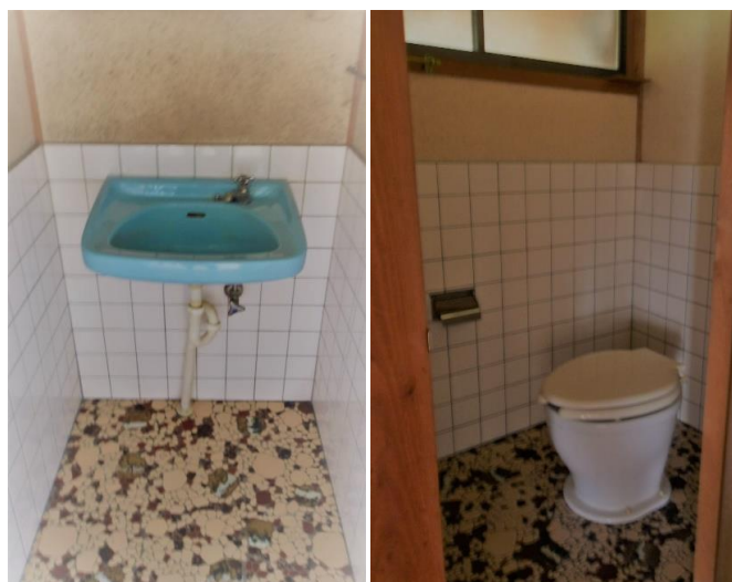
洗面 / トイレ