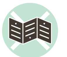
粘着剤がついた紙