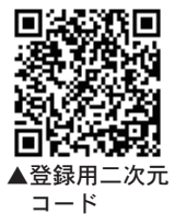
▲登録用二次元コード

の指定が可能 詳しくは、四国電力送配電株のホームページをご覧ください。 HP https://www.yondenco.jp/nw/cnt_line_notice/index.html