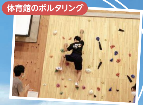
体育館のボルタリング