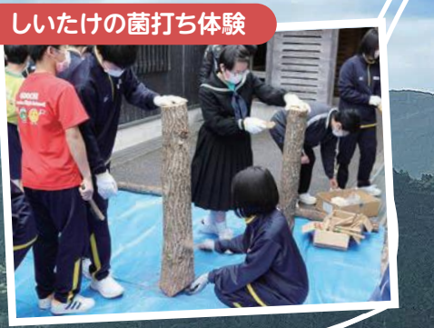
しいたけの菌打ち体験