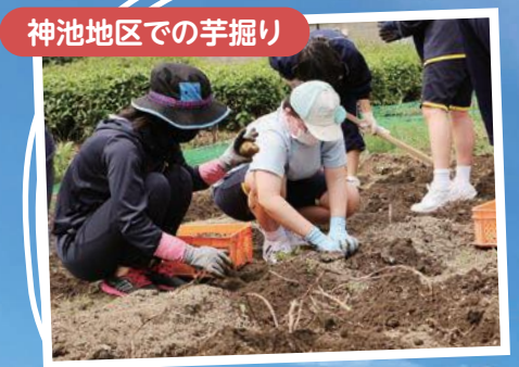
神池地区での芋掘り