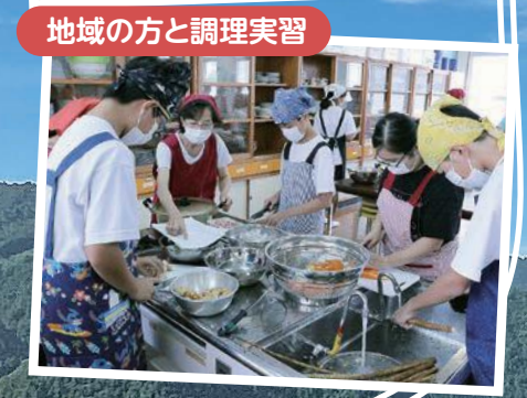
地域の方と調理実習