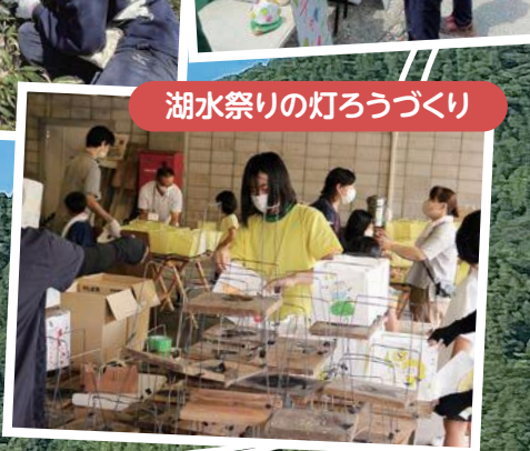
湖水祭りの灯ろうづくり