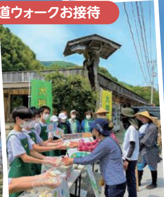
塩の道ウォークお接待