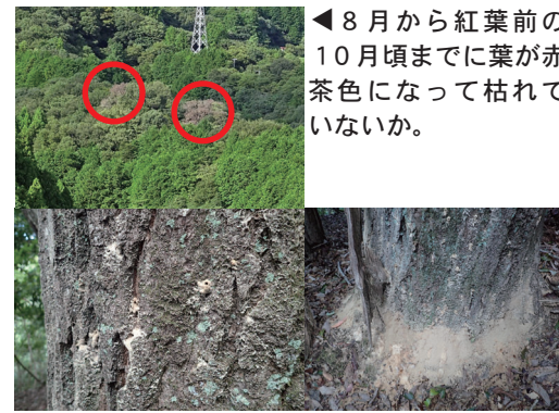
◀8月から紅葉前の10月頃までに葉が赤茶色になって枯れていないか。