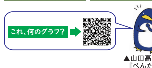
▲山田高校キャラクター『べんたん』