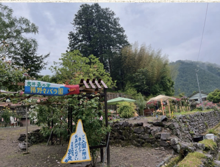
▲イベント会場のバラ園

バラの見頃は、種類にもよりますが5月上旬から6月中旬頃ということです。皆さんもぜひ、この機会に猪野々に足を運んでみてはいかがでしょうか！ (広報班 植村)