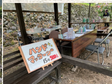
▲ハンドマッサージのコーナー

イベント当日はあいにくの雨でしたが、霧がかった里山風景と、雨粒をまとい可憐に咲くバラたちがとてもマッチしていて、いつもと違うバラの表情や景色が堪能できました。