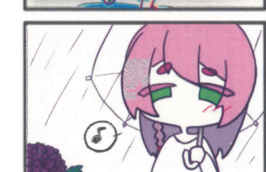
(山田高校マンガ部)