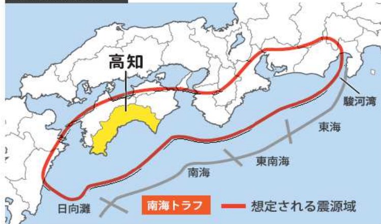
南海トラフ地震 想定震源域(内閣府)

過去の南海地震は、これまでおおむね100年から150年ごとに発生しており、東南海地震や東海地震と同時、または数十時間から数年の時間差で発生したことが知られています。