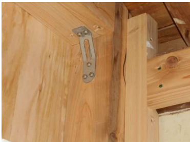
住宅耐震改修補助金