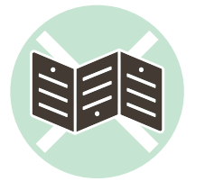
粘着剤がついた紙