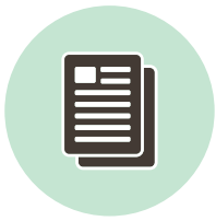
コピー・メモ用紙