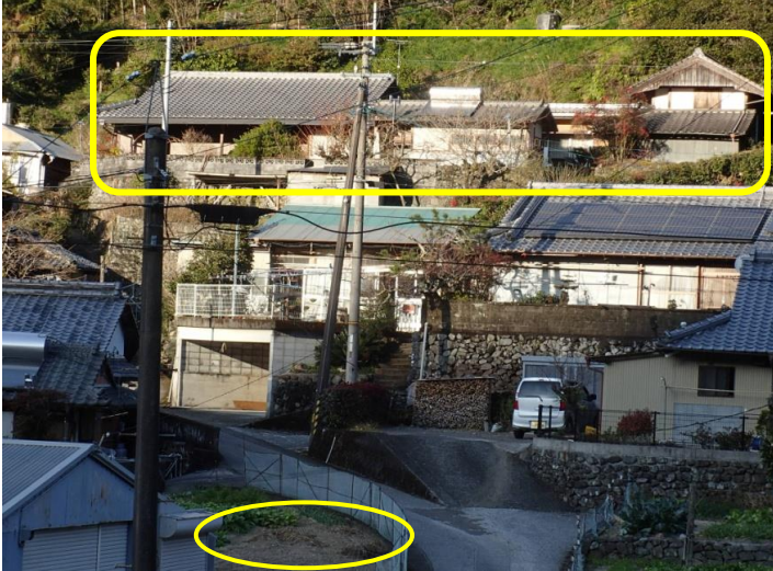
物件と駐車スペース