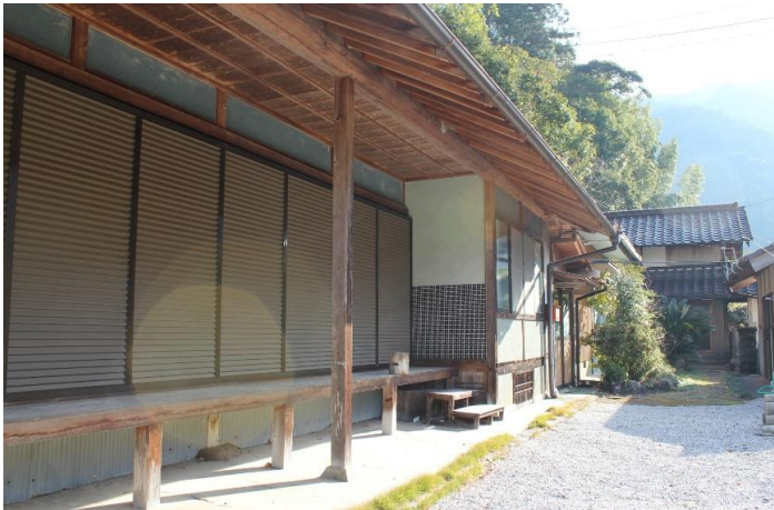
主屋外観(奥に納屋)