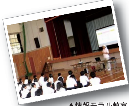
▲情報モラル教室 (鏡野中2年生)

電話は必要でない判断しており、原則校内持ち込みを禁じています。家庭での生活環境や学習習慣は子どもたちの学力に大きな影響を与えます。学校での出来事や社会のこと、将来の話など家庭でコミュニケーションの機会を持ち、励ましや声かけなどをお願ひします。