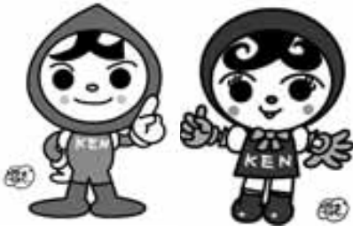
人KENまもる君 人KENあゆみちゃん

人権擁護委員は、住民の 皆さんが、人権の侵害を受 けることがないよう絶えず 見守り、もし人権が侵害さ れたときには、その相談相 手となったり、法務局と連 携して事実関係の調査を行 うなど、人権を侵された人 の人権の救済を図ることを 使命としています。人権に 関する困りごとや心配ごと がありましたら、お気軽に 法務局または人権擁護委員 にご相談ください。無料・ 秘密厳守で相談に応じます。