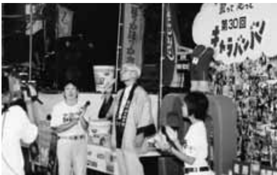
歌って走ってキャラバン