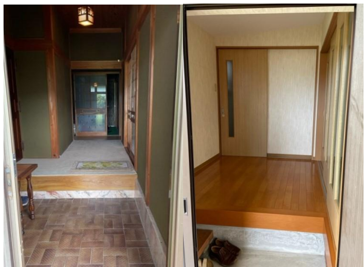
玄関 と 上がり口