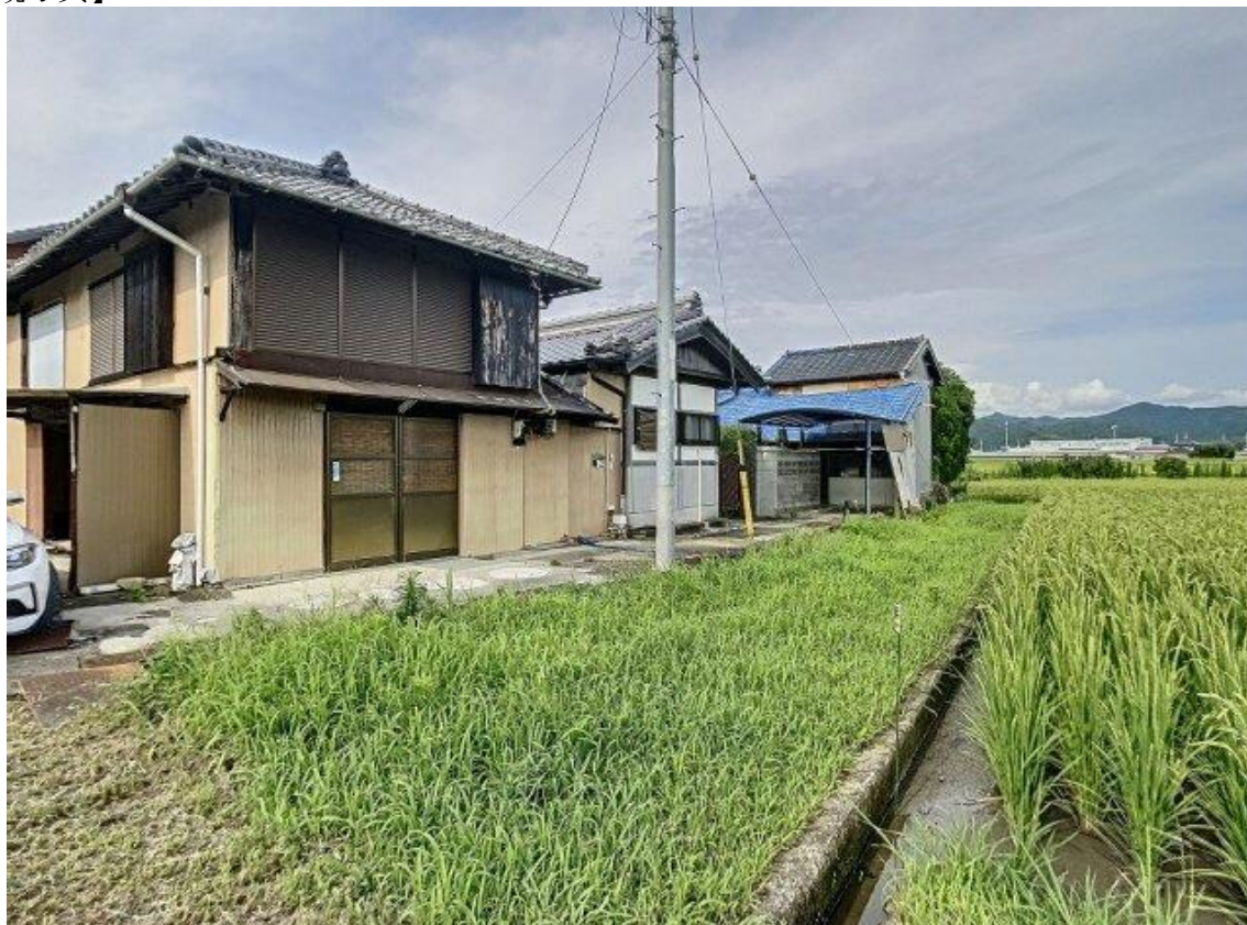
香長平野の田園地帯にある農家物件。菜園や物置も広く、徒歩圏内に空き家バンク物件に付属する農地もあります。