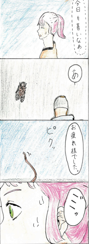
(山田高校マンガ部)