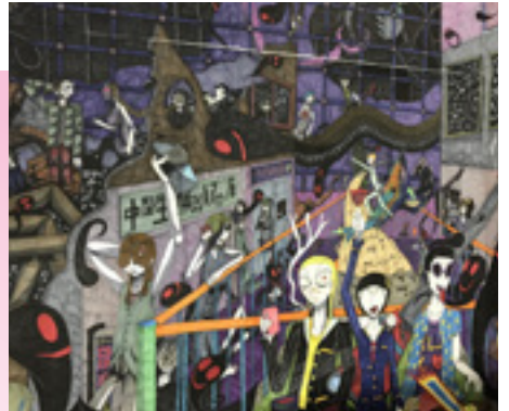
「リメイク・オブ・ザ・マキエダイパニック」(部分)