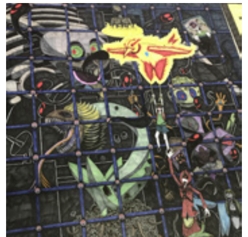
坂本周太郎 「リメイク・オブ・ザ・マキエダイバニック」 (部分)