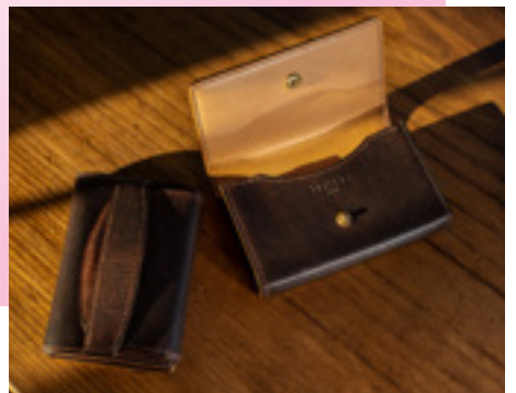
「獣害駆除された鹿の革小物」