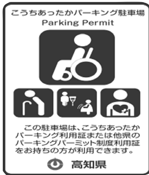
▲駐車スペース案内表示