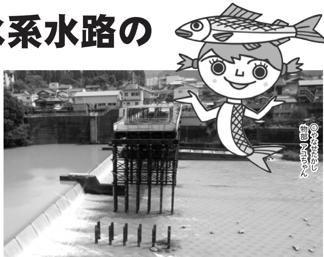
▲仮栈橋がかけられた物部川合同堰(9月12日撮影)

物部川合同堰の改修工事に伴い、山田堰土地改良区全水系水路の取水停止（水止め）を行います。 水止めの期間は次のとおりですが、物部川の増水等によって変更になることもあります。その場合は広報車等により変更をお知らせします。ご不便をおかけしますが、ご協力をお願いします。