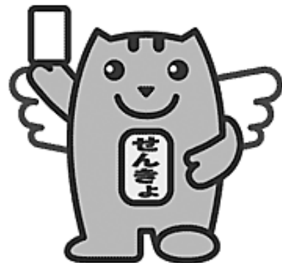
みんなの一票大切に！