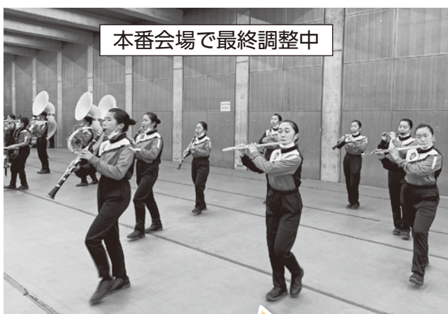
本番会場で最終調整中