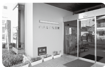
香美市立中央公民館