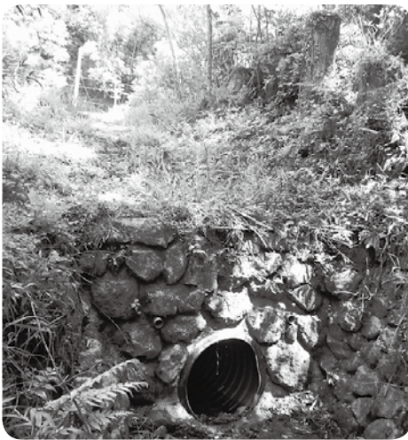
土佐山田町曾我部川 白岩川

等の影響もあり、白岩川への排水量が急速に多くなった。市道に隣接する暗渠の埋設部分が折れていることが分かり、早急な工事が必要となった。