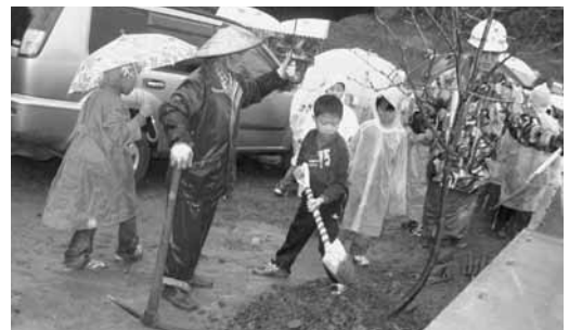
児童も参加して桜を植樹

トンネル近くの山林で整備を進めている「四季のもり（仮称）」で、十一月二十七日に桜の植樹を行いました。