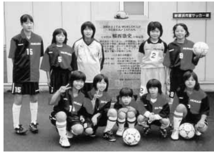
山田少年サッカー女子チーム

たちは新しい仲間を待っています。サッカーに興味のある女の子、一緒に練習しましょう！運動のできる格