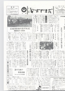
▲ 広報とさやまだ 昭和48年1月号

今年も終戦記念日がやって きます。この時期になると、 平和に感謝すると同時に、二 度と戦争を起こしてはならな いと強く思います。 さて、皆さんは『かわいそ うなぞう』という童話をご存 じでしょうか。かつては、小 学生向けの国語教科書に採用 され、絵本も多く発行されて いるため、一度は読んだとい う方も少なくないでしょう。 今回は、『広報とさやまだ 昭和48年1月号』に掲載され た、山田小学校2年の児童が 『かわいそうなぞう』を読ん で書いた感想文を掲載します。 当時の小学生は、お父さん、 お母さんが直接、戦争を体験 している世代です。戦争が身 近にあった分、今の子どもた ちとは、戦争に対する考え方 も少し違うのでしょうか。 ぜひ、ご一読いただき、平