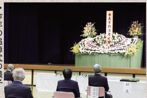
▶ 昨年の追悼式の様子

香美市では、毎年、戦没者の追悼式 を5月に行っています。 今年は、新型コロナウイルス感染症 の影響により、10～11月に行う予 定になっています。