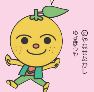
◎は土佐山田町、◎は香北町、◎は物部町です。