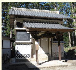
大川上美良布神社の神庫