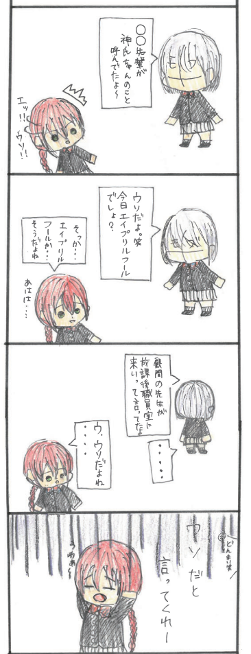
(山田高校マンガ部)