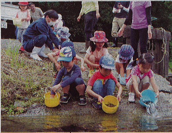
下ノ加江川に稚アユを放流する園児 (土佐清水市下ノ加江)

【清水】土佐清水市くの下ノ加江川に稚アユの下ノ加江保育園の園児約4千匹を放流し、見10人がこのほど、近た。