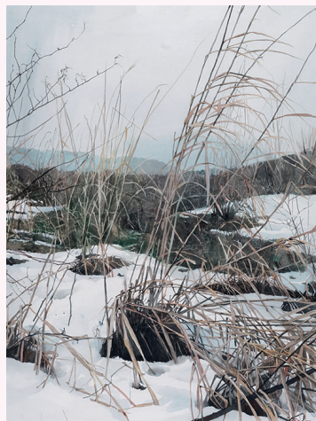
▲春まだき/藤井勉(中土佐町立美術館所蔵)