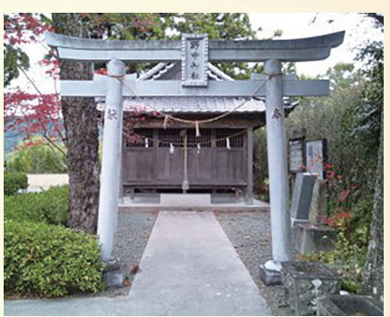
▲野中神社（お婉堂）土佐山田町中組

市民のひろばの『香美市イベント中止情報』はコロナ感染拡大防止のため中止と掲載されつつも残念に思うと同時に、一刻も早く