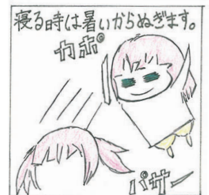
(山田高校マンガ部)