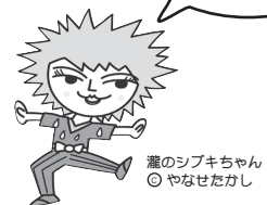
道のシブキちゃん ◎やなせたかし