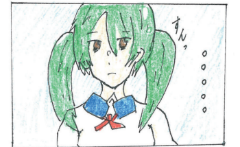
(山田高校マンガ部)