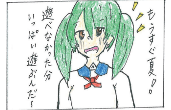
神氏ちゃん 夏休みの危機 153