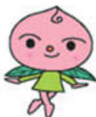
かりかり モモコちゃん