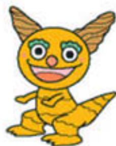
龍河洞 リユークン