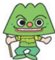
さんれい さんちちゃん