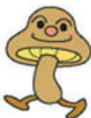
しいたけ たちちちゃん