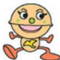
ぎんなん ぎんちゃん