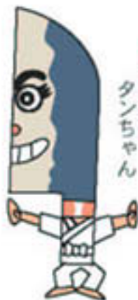
土佐打刃物 タンちゃん