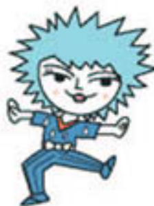
瀧の シンビキちゃん