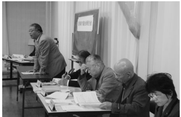
佐岡公民館（土佐山田町佐岡）

A 陳情と請願は、市民から議会に提出されるもので、請願には紹介議員が必要であり、表現は悪いが陳情よりも格が上である。議案、承認、同意は執行部から議会に提出されるも