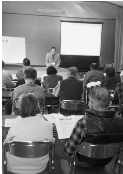
楠目老人憩いの家（土佐山田町楠目）