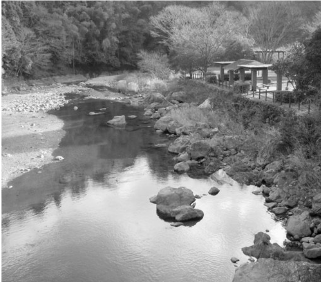
日ノ御子河川児童公園