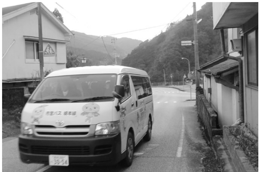
市営バス析本線（物部町大橋）

しいが素敵な看板にできないか。 答 看板は、修繕し改善したい。 問 暁霞地区公民館南側の旧小学校グラウンドを子どもが遊べるように整備を。 答 この広場は、現在災害時避難場所の指定地であり、地元にて維持管理されている。また、日頃は地区公民館の駐車場等として利用されていることから、児童公園的な整備の考えは無い。