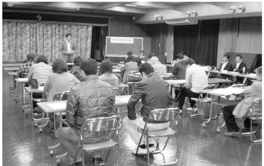
基幹集落センター（香北町美良布）