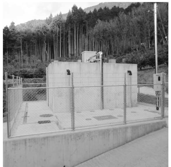
物部町楮佐古簡易水道施設

水道事業基本計画のつとり各施設等の耐震対策が急がれる。また、補助金の有効活用も必要である。