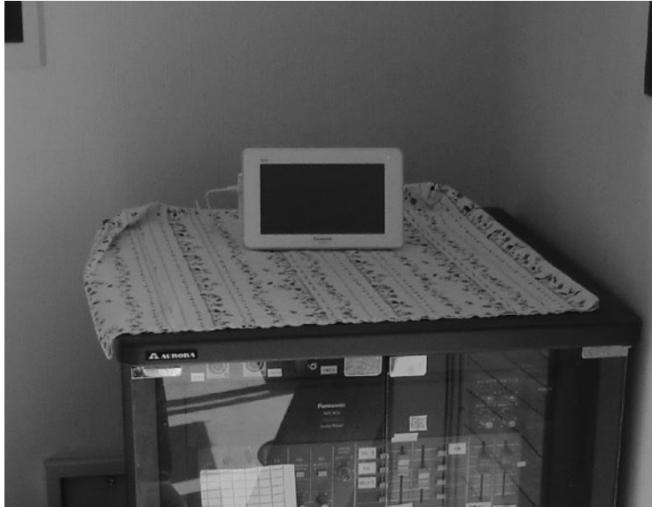
なかよし保育園の緊急地震速報機

答 緊急地震速報機を設置している保育園には、受信に注意を促しているが、未設置の学校には特に指導していない。