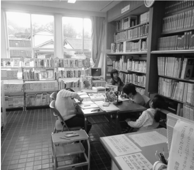
もんべえクラブの子どもたち（開発センター物部）

答 事業計画書及び毎月の報告書や施設訪問等で状況を把握するよう努めている。また、連絡協議会を今年度は2回開催する予定であ