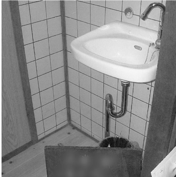
制度を利用してリフォームしました

問 現時点における工事完成状況は。 答 12月7日現在で39件、補助金額で544万円である。 問 申請後、辞退に至った件数及び理由は。 答 資金調達困難1件、家庭の事情2件である。 問 利用された対象工事の詳細は。また、小額工事の状況は。 答 外装工事25件、内装工事13件、設備工事11件、それらの複合が16件である。小額工事は10万円台規模からとなっている。 問 申込み等にて却下されたケースは。 答 事前に可能性についての問い合わせがあるため、申請時段階での却下は無い。 問 施主、施工業者の実施後の評価は。 答 良好と受け止めている。 問 次年度に向けて行政主体の説明会開催、