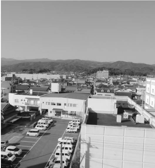
庁舎より市街化区域を望む

事前の基準点先行や終了区域連結により効果を高めている。集中的に調査をしている山間地域は筆界を知る地権者の高齢化等により確認作業が困難な状況となりつつある。これまでに多くの問合せに対し、調査予定区域の答えをしており、現段階での変更は困難である。指摘のとおり、進捗率を高め効果を挙げることは重要で、各種計画との整合性やその体制整備が必要と考えている。