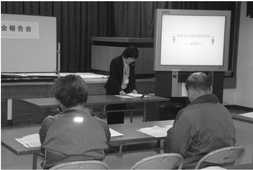
開発センター物部（物部町大栃）

Q 日常的に議員活動に A 例年予算を計上し、計画的に進めている。 Q 地籍調査を進めてほしい。 A 議員の姿があまり見えないとの指摘もあるが、調査研究や自己研鑽、会派の勉強会などもあり、市民との対話が十分に取れない場合もある。 ついて、個々の議員はどのような活動を行っているのか。 A 議員の姿があまり見えないとの指摘もあるが、調査研究や自己研鑽、会派の勉強会などもあり、市民との対話が十分に取れない場合もある。