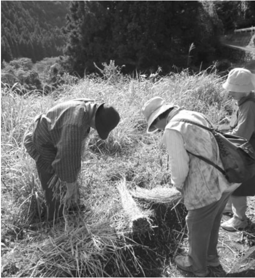
里のくらし（物部町久保）

保障の削減、縮小を法制化し、一層の構造改革路線が強制力をもって進められることとなる。以下に問う。