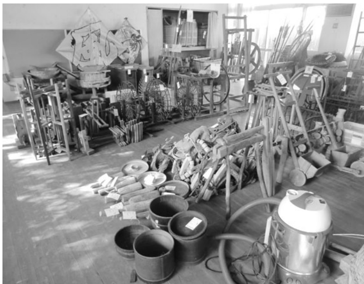
整理作業中の古民具

問 香北支所の旧公民館に先人たちが使用した生活用具や農具等が多く集めてあった。その古民具は整理整頓もされず無造作な状態で保管されていた。先人たちがこれらの民具を使ってどの様な生活、農作業を行っていたか知るうえで貴