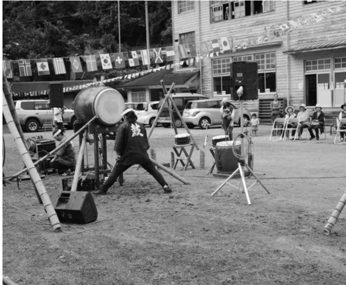
旧久保小学校でのイベント

山間部では、飲料水を井戸や谷川などに頼る地域があるが、水源が枯渇したり、高齢化等により管理が困難になっている。また、買い物や通院などの日常生活への不安、有害獣による農作物への被害など深刻な悩みがある。このような様々な状況を支援するため、物部町久保・大西・南池をモデル地域として「地域づくり支援員」が配置され、10月には別府市宇・別役にも配置された。