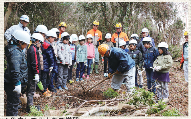
▲集中してみんなで学習

1月24日、甬喜ヶ峰森林公園へ大宮小学校3年生とどんぐりの植樹に行ってきました。さかのぼること3年前、美良布保育園、片地保育園、大板保育園の園児たちが美良布保育園で『森の教室』というイベントに参加しました。園児たちはそこで、森が私たちの生活にどんなに大切なところかということを知り、コナラとクヌギのどんぐりをみんなで植えました。このどんぐりから芽を出した苗木を、この度、森に植樹をするということで特別