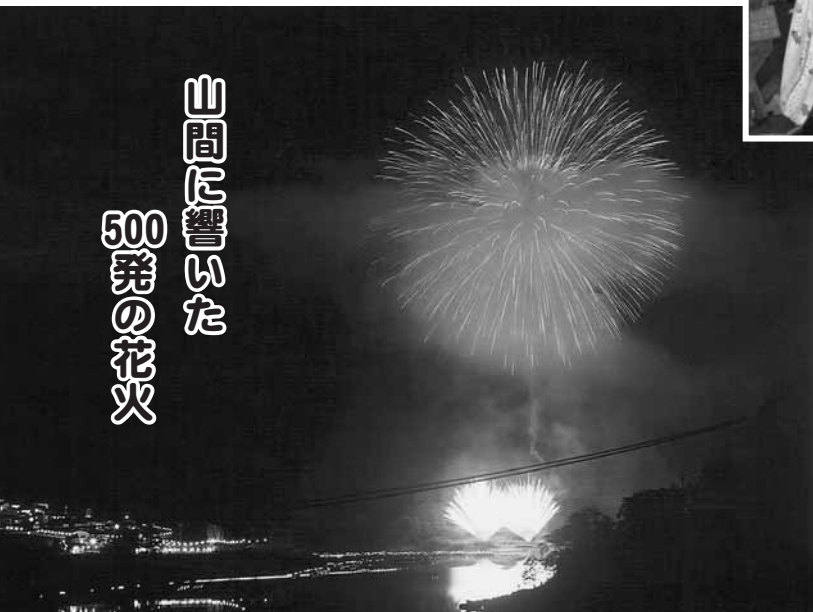
山間に響いた 500発の花火