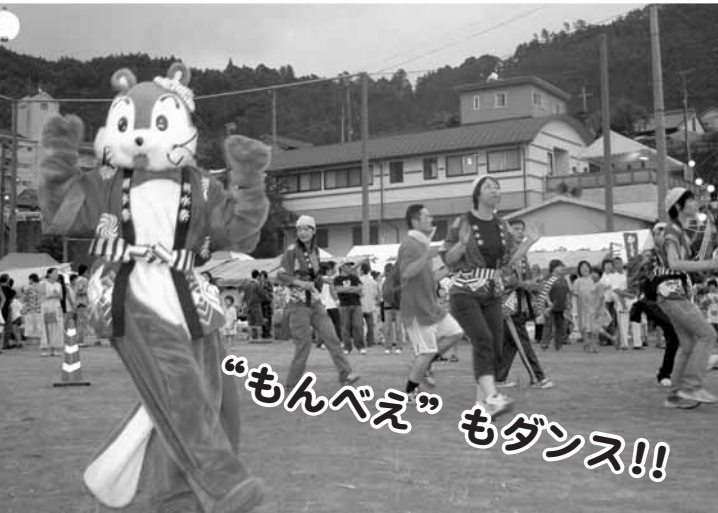
“もんべえ”もダンス!!