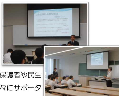
パイロットからも話が聞けます

このキャリアチャレンジデイは、講師の方だけでなく、保護者や民生委員、山田高校生・高知工科大学生など、多くの地域の方々にサポーターとしてご協力をいただき開催しています。