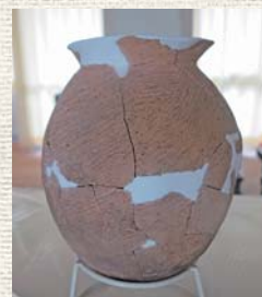
▲文化財事務所所蔵、弥生時代の土器(甕) 伏原遺跡出土

生涯学習振興課では、調査が終了するころに、現地説明会を行う予定です。詳しくはお問い合わせください。 ☎53-1082