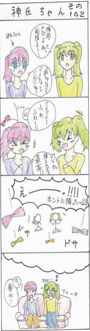
(山田高校マンガ部)