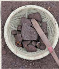
▲約2㎡でこれだけの破片を発掘しました

埋まっている物を傷つけないように、震える手で地面を丁寧に削っていくと、土師器と呼ばれる赤茶色の土器の破片や、須恵器と呼ばれる灰色の土器の破片をいくつか見つけることができました。これらの破片がまとまって多く見つければ復元することも可能だとのこと。僕が見つけた破片も復元される一部になってくれるとうれしいですね。