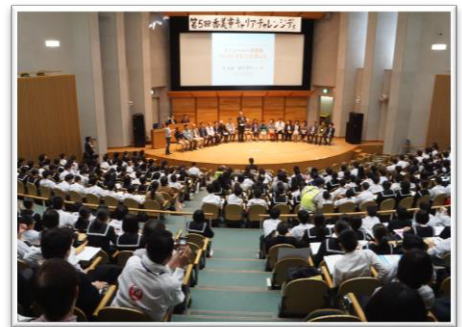
講堂での一斉授業の様子

また、地域の方で、当日ボランティアとしてお手伝いいただける方も募集をしております。6月頃に募集のご案内をさせていただきます。多くの方に関わっていただき、開催したいと思っておりますので、ご協力をお願いします。