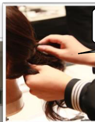
美容師のブースでは、体験もやりました。