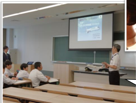
直接、パイロットから話が聞けました