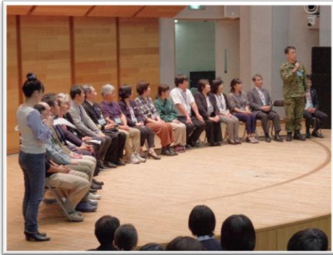
フース講師: 自衛隊高知協力本部