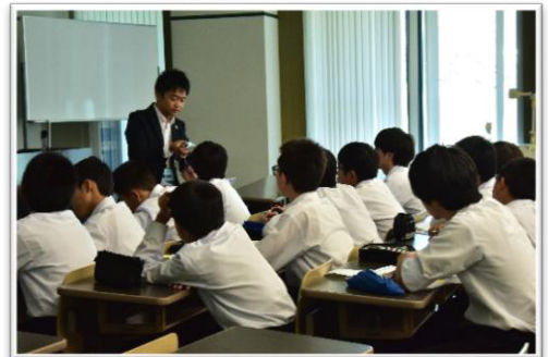
フース講師：高知県商工労働部産業創造課

普段、あまり意識せず生活していたシステムエンジニアの仕事ですが、お話を聞き、身近なところにITがあって驚いたのと同時に、私の住んでいる物部でもITがたくさん見られるようになったらよいと思いました。また、県外に行かなくても県内でできるように考えているところがさすがだなと思いました。今後、県内の仕事が増えたらいいなと思いました。