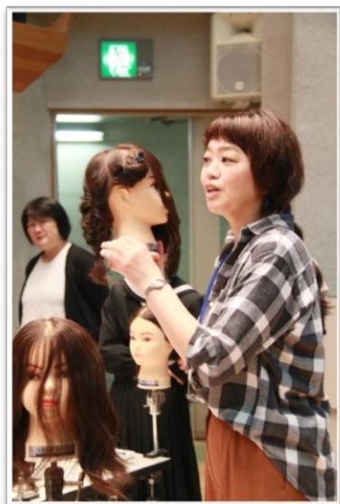
フース講師: 国際デザイン・ビューティカレッジ(理容師・美容師)

私が一番驚いたことは、美容師は50年後もなくなる仕事だということです。また、一番心に残ったことは、「お客さまの小さな幸せが自分たちの幸せでもある」という話です。美容師という仕事は、人を喜ばせることのできる仕事なので素晴らしいなと思えました。