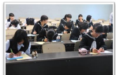
フース講師：国際デザイン・ビューティ カレッジ(建築)