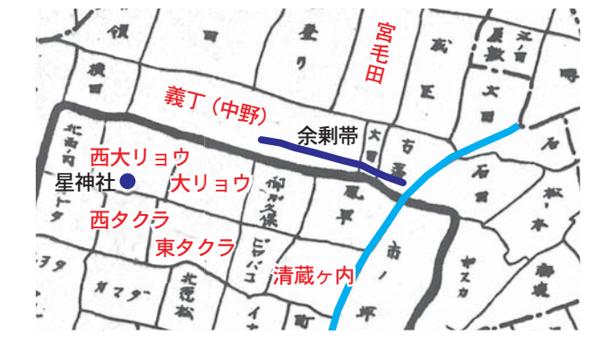
▲土佐山田町史の小字図より。青線は金丸川。中世に水上交易があり、浦戸湾に通じていた。

『日本後記』に、延暦24年（805年）「土佐国香美郡少領外従六位上物部鏡連家主」とあり、郡役所跡と推察される。岩次集落の場所はタクラで田倉、東に清蔵ヶ内が せいぞう あって正倉ヶ内がなまったものと見られ、これは班田収授の法で定められた口分田の税である米を収める倉のことである。