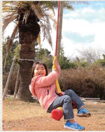
▲特設の竹製ブランコ

※木工教室は電話予約が必要です。その他イベントなどもありますので、詳しくは情報交流館のホームページをご覧ください。HP https://www.k-kouryūnet/