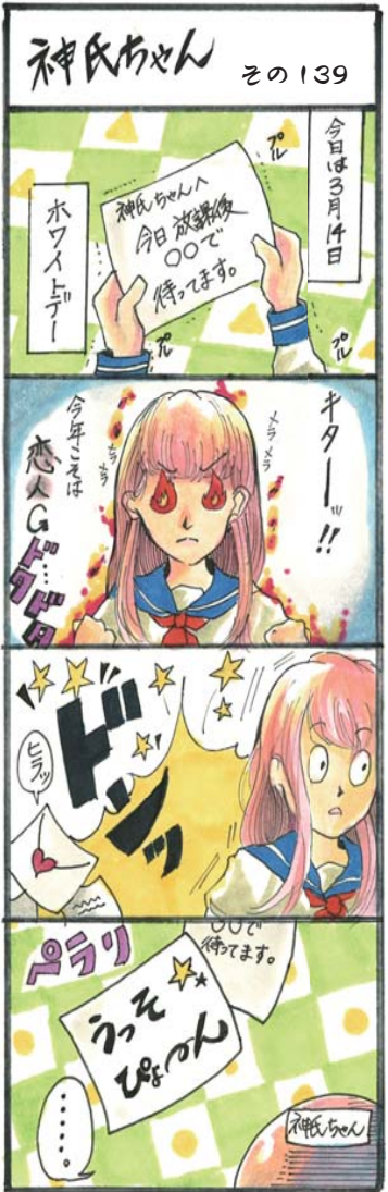
(山田高校マンガ部)