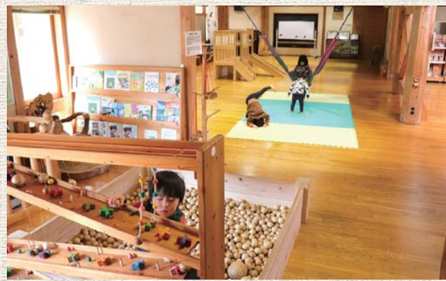
▲木の温もりが伝わる屋内で、夢中になって遊ぶ

ここは森林に親しむことをテーマにした施設。建物の中に一步入ると、優しい木の温もりに包まれた素敵な空間が広がります。木のボールプールやすべり台、木工パズル、車のおもちゃなど、小さな子ども