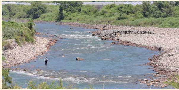
香美市の大動脈物部川