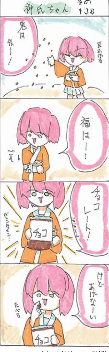
(山田高校マンガ部)

美良布地区集落活動センター推進協議会 ☎52・9708 【出店】ハンドメイド布小物・絵本・アクセサリーワークショップ・多肉植物寄せ植え・ナポリピッツアなど