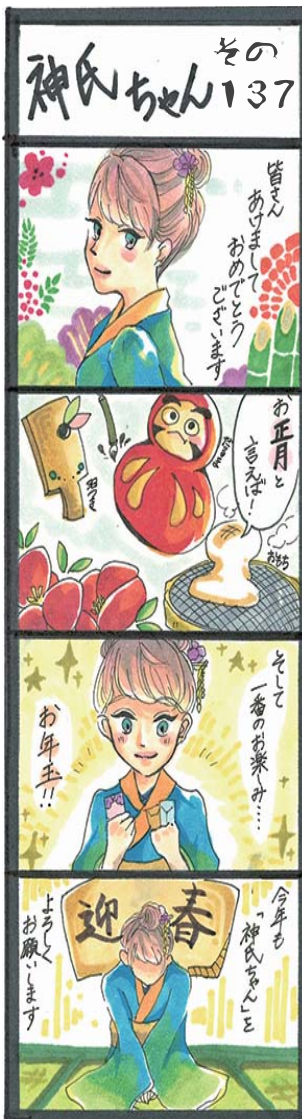
(山田高校マンガ部)