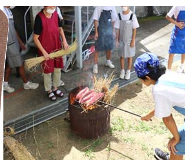
▲カツオのタタキづくり(大橋中)

働本部(学校支援地域本部)の活動を積極的に進め、あらゆる場面で、たくさんの方々に子どもたちの育ちを支えてもらっています。 子どもたちは、その活動の中で地域の歴史や宝を知り、一緒に活動した大人たちの姿から多くのことを学んでいることと思います。