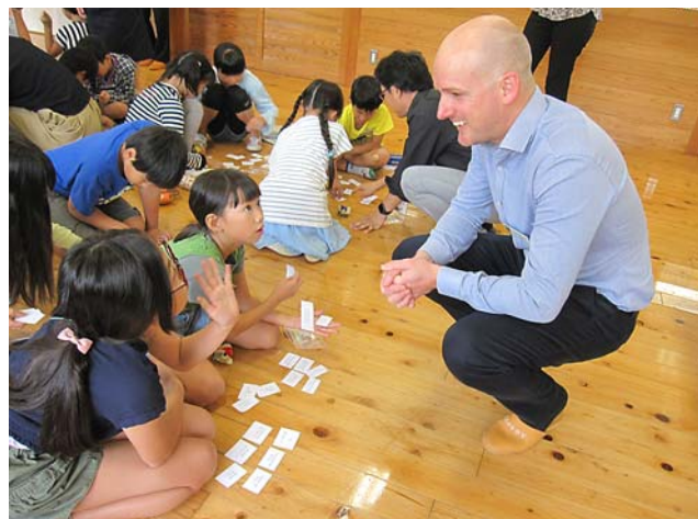
▲大宮小は国際バカロレア教育の認定校を目指している

を高める授業づくりに努めてきた成果だと思われま。また今後の課題として、漢字や数学用語に関する意味を理解して活用する力や、情報を整理して内容を捉え、目的に応じて適切に表現する力などに課題がありました。 この調査結果をもとに、それぞれの小中学校では、子どもたちが学習のどの部分でつまづいているかを詳しく分析し、授業の改善に努めていきます。 さらには、家庭学習の充実や放課後学習への取り組みなども