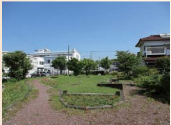
▲現在の伏原大塚古墳

位置的には長岡台地の南東部。見晴らしがよく、香長平野を見渡すことができる。6世紀末～7世紀前葉の古墳で、上から見ると一辺が約34mの四角形(方墳)をしており、周囲に溝が巡らされていたようだ。この溝を含めると、南北約38m、東西約43mもの大きさになる。これは方墳としては四国最