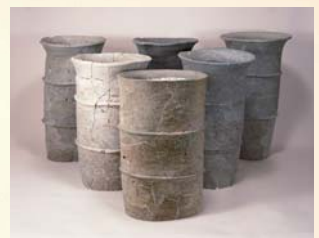
▲伏原大塚古墳の円筒埴輪

大級のものである。古墳の大きさは葬られた人が生きていた時に持っていた権力の大きさと比例する。つまり、高知県で最も権力を持っていた人が、当時の香美市にいたことになるだろう。