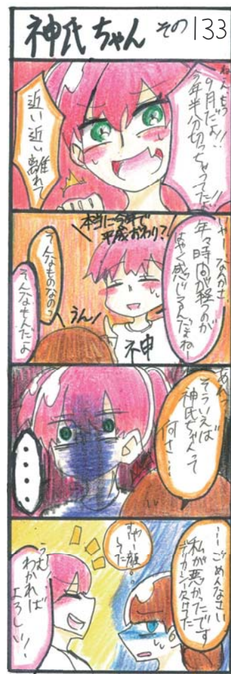
(山田高校マンガ部)

掲載を希望される方を募集中！ 申し込みは誕生月の前月1日まで。 問 総務課 ☎53-3112