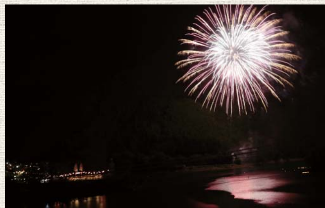
▲湖水祭では、湖面に映る花火と灯ろうと一緒に楽しめる

8月に入ると毎週のように市内のどこかで花火が上がり、予定を立てればお腹がいっぱいになるまで堪能できるはず。来年もぜひ、地元のお祭りを遊び尽くしてみてください。(小松)