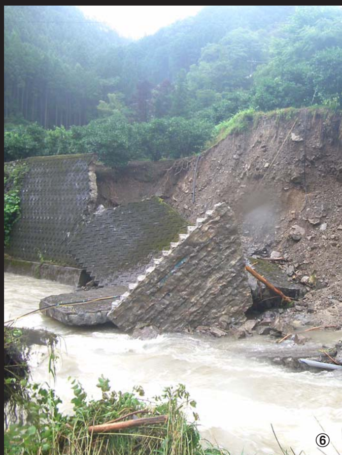
④林道河口落合線(物部町)。雨水が舗装の下の土を流して陥没。非常に危険な状態に⑤林道仁尾ヶ谷線(物部町)。土砂崩れにより通行止め状態に⑥庄谷相川の護岸が崩落(物部町)。ユズの農地にも被害が及んだ