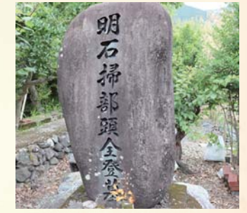
▲明石掃部頭の墓と伝わる碑

五台山の明石氏は、土佐藩仕置役であった小倉少助を頼って来国したと伝えられる。小倉少助は、山田堰にも名前が残