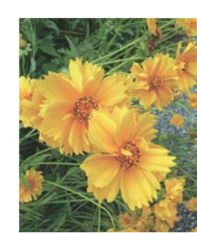
▲オオキンケイギク

この花の種をまいたり植えたりすることは法律で禁止されています。きれいだからといって、自宅の庭や花壇に植えないでください。特定外来生物の防除にご協力をお願いします。