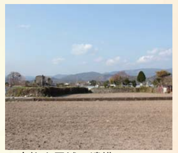
▲高柳土居城の遺構