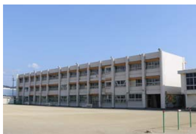
▲対象は舟入小・山田小・楠目小・片地小・香長小・大宮小・大橋小・香北中。改修済みは鏡野中・大橋中。

非構造部材(天井・壁・機器固定など)の耐震改修を行います。構造部分の耐震改修は、すでに全小中学校で施工が完了しています。