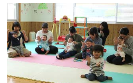
▲多様化する子育てのニーズに応じていくための新規事業(写真は子育てセンターなかよしの様子)。

子育ての援助を受けたい人と子育てを支援したい人の連絡・調整を行い、安心して子育てができるよう、地域で支え合う有償ボランティア組織です。