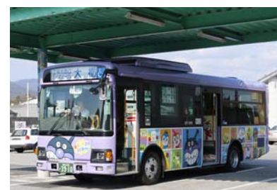
▲保護者の経済的な負担軽減とともに、中山間地域への定住促進やバスの利用促進などの効果も見込む。