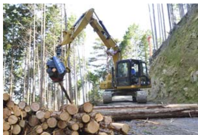
▲世界的大イベントへの木材提供は、市産材をアピールするチャンス。

2020年の東京オリンピック・パラリンピックの選手村ビレッジプラザに、CLT工法の原料となる木材を提供し、香美市産木材のPRを行います。 ※高知県・大豊町・香美市の共同事業