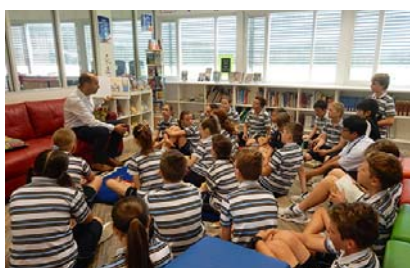
▲香美市との交流が始まったオーストラリアのイマニュエル小学校も、国際バカロレア教育の認定校。

国際的視野を持った人材を育成するための、チャレンジに満ちた国際教育プログラム。大宮小を候補校として申請。認定校になるまで3年間かかります。