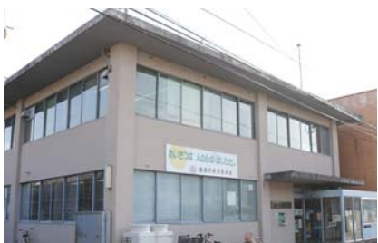
▲老朽化している現在の市立図書館。新図書館の建設とともに、蔵書や機能の充実も図っていく。

香美市の知の拠点として、新しい図書館を建設します。今年度は新図書館の設計委託(プロポーザル方式)とともに、建設用地の調査等を行います。