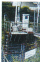
しげとう 繁藤地区にある 「甫喜ヶ峰疎水」の トンネル入口

昔は水不足で、水を奪い合っていたため、当時の人々が甫喜ヶ峰疎水を作ったそうです。今の僕たちが水を飲めているのは、昔の人のお陰だと知り、甫喜ヶ峰疎水を「香長の家宝」にしたいと思いました。