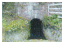
平山地区にある 甫喜ヶ峰疎水」の トンネル出口