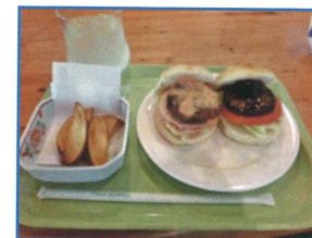
ジビエ料理の鹿バーガー